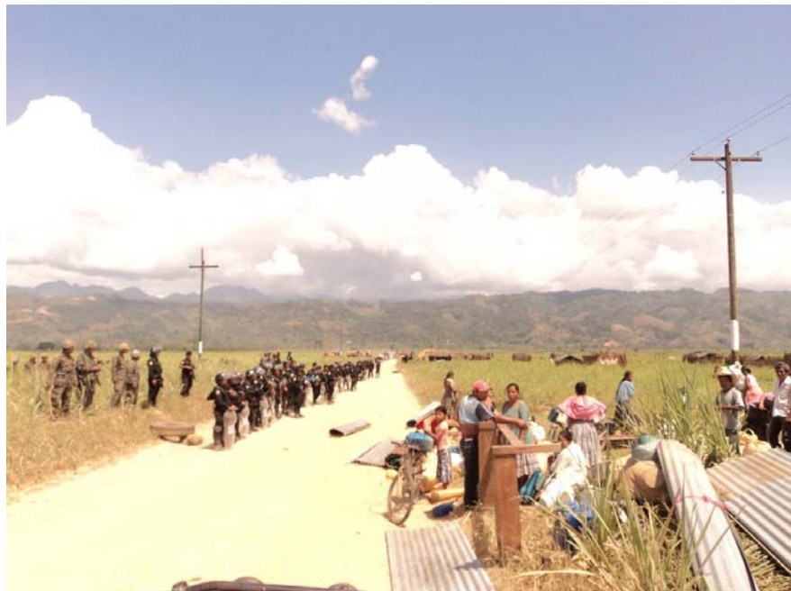
Miralvalle, Valle de Polochic, Guatemala, 15 de marzo de 2011. La comunidad fue expulsada, y sus casas y cultivos destruidos.

La nueva oleada de acuerdos sobre tierras no es la inversión en agricultura que millones de personas esperaban. Las personas más pobres son quienes más sufren cuando se intensifica la competencia por la tierra. Las investigaciones de Oxfam demuestran que la población local suele salir perdiendo frente a las élites locales y a los inversores nacionales o extranjeros, ya que carece de poder para hacer valer sus derechos y defender sus intereses eficazmente. Las empresas y los gobiernos deben adoptar urgentemente medidas para que se respete el derecho a la tierra de las personas que viven en la pobreza. Además, si se espera que las inversiones contribuyan a mejorar la seguridad alimentaria y los medios de subsistencia de las personas en lugar de minarlos, las relaciones de poder entre los inversores y las comunidades locales tienen que cambiar.